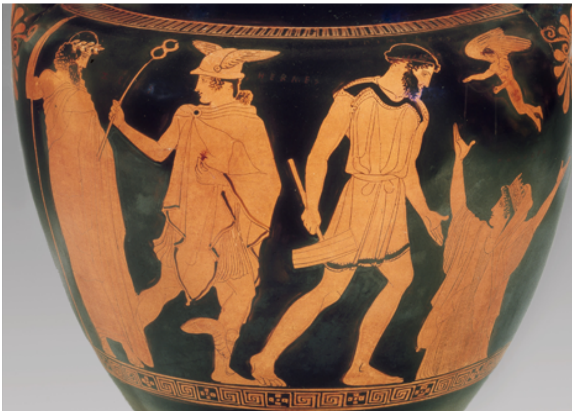
Jean Cousin, « Eva Prima Pandora »; 1525-1550 (Musée du Louvre RF 2373) Cratère à figure rouges, 475-425 av. J.-C. (Oxford. Ashmolean Museum G275)

Autant pour la Grèce ancienne que pour le premier christianisme, s'il y a un mythe fondateur qui est significatif du point de vue de ce que nous concevons comme la sexualité, c'est bien le récit de la création de « la femme ». Elle a pour nom Pandôra du côté du polythéisme grec, et Ève du côté du monothéisme judéo-chrétien. L'une est mise en scène par un récit en diction homérique intégré dans le poème épique sur Les travaux et les jours d'Hésiode, l'autre dans le récit de la création du monde qui ouvre la Genèse , traduite en grec dans la Septante . Or, en anthropologie culturelle et sociale, toute analyse comparative et différentielle sensible aux valeurs qui sont propres aux cultures comparées part d'un problème du présent pour y revenir, de manière critique – en l'occurrence la question de la sexualité, en particulier dans l'histoire qu'en a tracée Michel Foucault entre Antiquité gréco-romaine, christianisme et modernité.