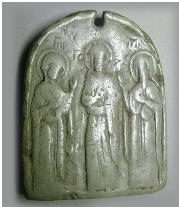
Fig. 2 : Relief avec Jésus, la Vierge et saint Jean, fin XI e -XII e siècles, stéatite, H. 6,4 cm ; l. 5,1 cm, Paris, BnF, DMMA, Froehner.2041 ; Froehner.XIV.51.

Quant aux fragments de plaque en stéatite, ils constituent l'un des traits saillants de la collection byzantine de Froehner. Ces objets sont rattachés par la nature de leur matériau à la glyptique, car celle-ci est l'art de graver des pierres fines. La stéatite, pierre tendre et facile à sculpter, était souvent utilisée pour créer des sceaux, des amulettes et des petites sculptures. Une plaque complète [14] et trois fragmentaires [15] forment cet ensemble issu de la collection Froehner. Intéressons-nous à deux exemplaires de celui-ci. Le premier objet est une petite plaque arrondie (hauteur : 6,4 cm ; largeur : 5,1 cm), au sommet et percée d'un trou de suspension dont la partie supérieure est arrachée, qui représente une Deesis (fig. 2) [16]. Le Christ, dont le nimbe est crucifère, est debout de face, bénit de la main droite et est entouré de la Vierge Marie et de saint Jean-Baptiste. Au revers est gravée, de manière très schématique, une croix latine combinée avec un chrisme. L'inscription en grec au-dessus des personnages permet de les identifier sans ambiguïté : Μ[ήτηρ] θ(εο)ύ, Ι(ησού)ς Χ(ριστός), Ιω(άννης) [17].