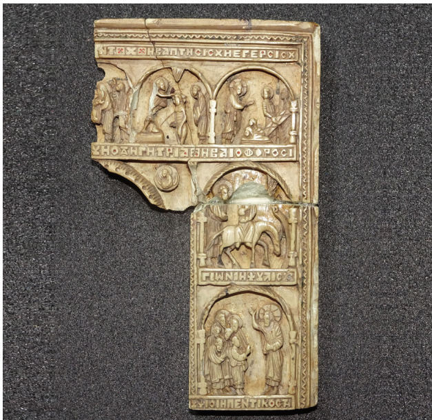
Fig. 3 : Relief avec scènes de la vie du Christ, XIV e siècle, stéatite, H. : 8,1 cm ; l. : 4,8 cm, Paris, BnF, DMMA, Froehner.2972 ; Froehner.XIV.152.

est séparé par une ligne d'inscription grecque [20]. Le style, qui trahit une influence italienne gothique existante dans les stéatites tardives [21], nous indique qu'il s'agit d'une réalisation des Paléologues, probablement du XIV e siècle. Froehner, avec ces fragments et son exemplaire complet, s'inscrit dans la passion des byzantinistes de son temps : Schlumberger, dans son article de 1903 consacré à deux beaux reliefs en stéatite appartenant à la comtesse de Béarn, dresse une liste des principaux possesseurs de reliefs en stéatite (lui-même, la comtesse, le musée du Louvre, le musée de Berlin, le British Museum, etc.) sans citer les exemplaires « froehneriens », sans doute acquis à une date postérieure à la publication de son article. Les objets cités par Schlumberger viennent principalement de Constantinople, l'actuelle Istanbul [22], plaque