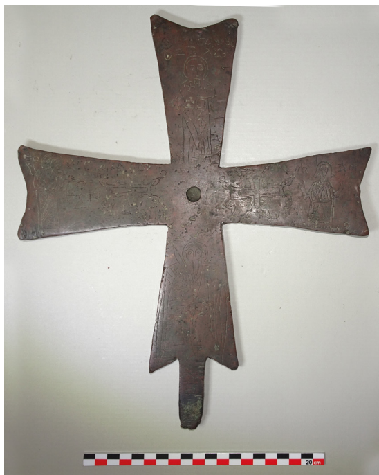
Fig. 4 : Croix reliquaire avec bélière mobile représentant saint Pierre, XI e siècle, bronze, H. : 9,2 cm, l. : 4,6 cm, Paris, BnF, DMMA, Froehner.766bis.