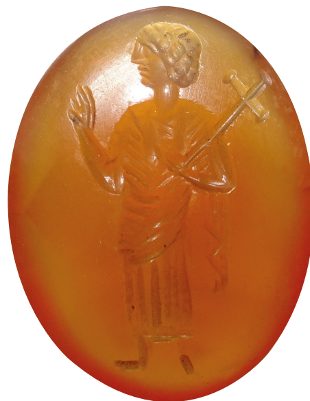
Fig. 1 : Avvers de l'intaille représentant Jésus (ou un saint bénissant), IV e -VI e siècles, cornaline, H. 2,05 cm ; l. 1,55 cm ; ép. 0,55 cm, Paris, BnF, DMMA, Froehner.2926.

Ce qui est vraiment marquant au sein de la collection, c'est la prépondérance des objets byzantins portant des représentations de personnages sacrés (figures du Christ, de la Vierge et de saints), accompagnés d'inscriptions. L'art de la glyptique, développée à partir de l'époque hellénistique et magnifiée à l'époque impériale romaine, s'est perpétué dans le monde byzantin. L'intaille magique servant d'amulette chrétienne en est une bonne illustration (fig. 1)[6]. Il s'agit d'une cornaline convexe (hauteur 2,05 cm ; longueur 1,55 cm ; épaisseur 0,55 cm), qui représente sur l'avvers un personnage (Jésus ou un saint ?), vêtu