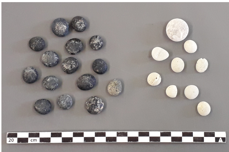
Fig. 3 : Jetons de l'épave Culip IV , 19240. Musée d'archéologie de Catalogne.

même que ce navire soit chargé de transporter des passagers entre Dyrrachium et Brindisi, seule liaison connue sur laquelle naviguaient des navires spécialisés dans le transport de voyageurs [44]. La découverte de dés en ivoire dans l'épave de Punta Patedda indique la présence de passagers particulièrement aisés, ce que le reste des vestiges confirme [45] : des gobelets en céramique signés par des artisans qualifiés, ainsi que des onguents orientaux dans de petits vases inscrits, ont également été retrouvés non loin des objets ludiques [46].