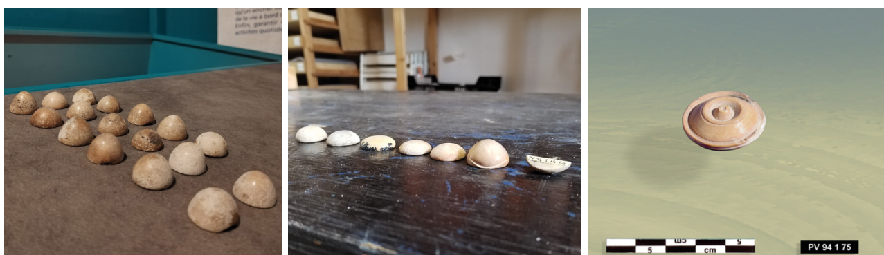
Fig. 5 : Jetons de l'épave Port-Vendres 1, PV.94.1.74.1 à PV.94.1.74.24 & PV.94.1.75.

Les fouilles de l'épave Port-Vendres 1 ont fourni 25 jetons : vingt en os, un en pierre et quatre en bois. Tout individu, qu'il soit marin, capitaine, officier ou passager, a pu être propriétaire de ces objets. L'intégralité de ce lot demeure incertaine en raison du pillage de l'épave, mais trois types de jetons ont pu être répertoriés : les deux premiers sont dotés d'une face plane et d'une bombée, mais possèdent une différence de hauteur. Le troisième type de jetons, plus élaboré, n'est représenté que par un seul exemplaire (fig. 5). Ce dernier pourrait être l'attestation d'une volonté de compléter un set de jeu, mais cette hypothèse semble