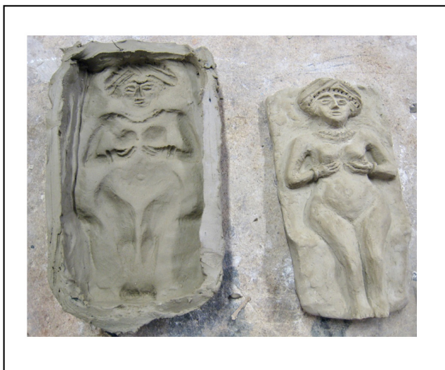
Fig. 10 : Matrice déjà cuite (à droite) et moule en argile crue (à gauche).

démoulage se fait alors en introduisant une lame le long des parois verticales, puis en tirant sur l'argile crue afin de la décoller (vidéo 2 et fig. 10). La pâte étant prête, l'estampage a été réalisé en seulement 4 minutes et 30 secondes par Catherine Remmy, potière expérimentée. Il est encore possible ensuite de retoucher la partie moulée, éventuellement de remodeler ou de lisser avec les doigts à ce moment. Un moule est réussi si tous les détails sont bien visibles et si l'image n'est pas déformée. Il reste à modeler les quatre bords du moule que l'on coupera et lissera afin d'obtenir la réplique de l'objet original. Puis ce moule en creux devra être bien séché avant d'être cuit. Il pourra alors servir à estamper d'autres figurines en relief.