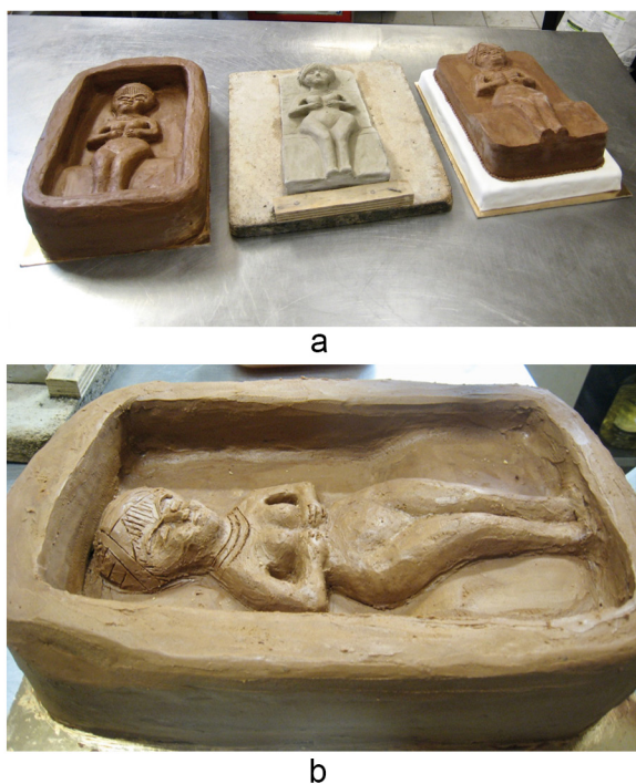
Fig. 13 : Deux gâteaux en chocolat et matrice en argile cuite (a), détail gâteau (b), photos I. Weygand.

de la préparation de la terre, la pioche, la pelle, les canifs, les briques réfractaires ont été utilisés alors que les outils des Mariotes étaient en roseau, en bois et en silex (couteaux et pioches). Se centrer sur la reproduction des figurines était prioritaire à reconstitution d'outils antiques.