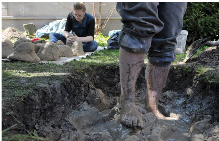
La fabrication d'un four primitif et des figurines anciennes.

A quoi correspondaient les « figures féminines nues » en terre cuite qu'on trouve dans l'Antiquité, du Proche-Orient à l'Asie centrale, en passant par l'Égypte ? En attendant le colloque du mois de juin à Strasbourg, une équipe d'enseignant et d'étudiants met... la main à la pâte.