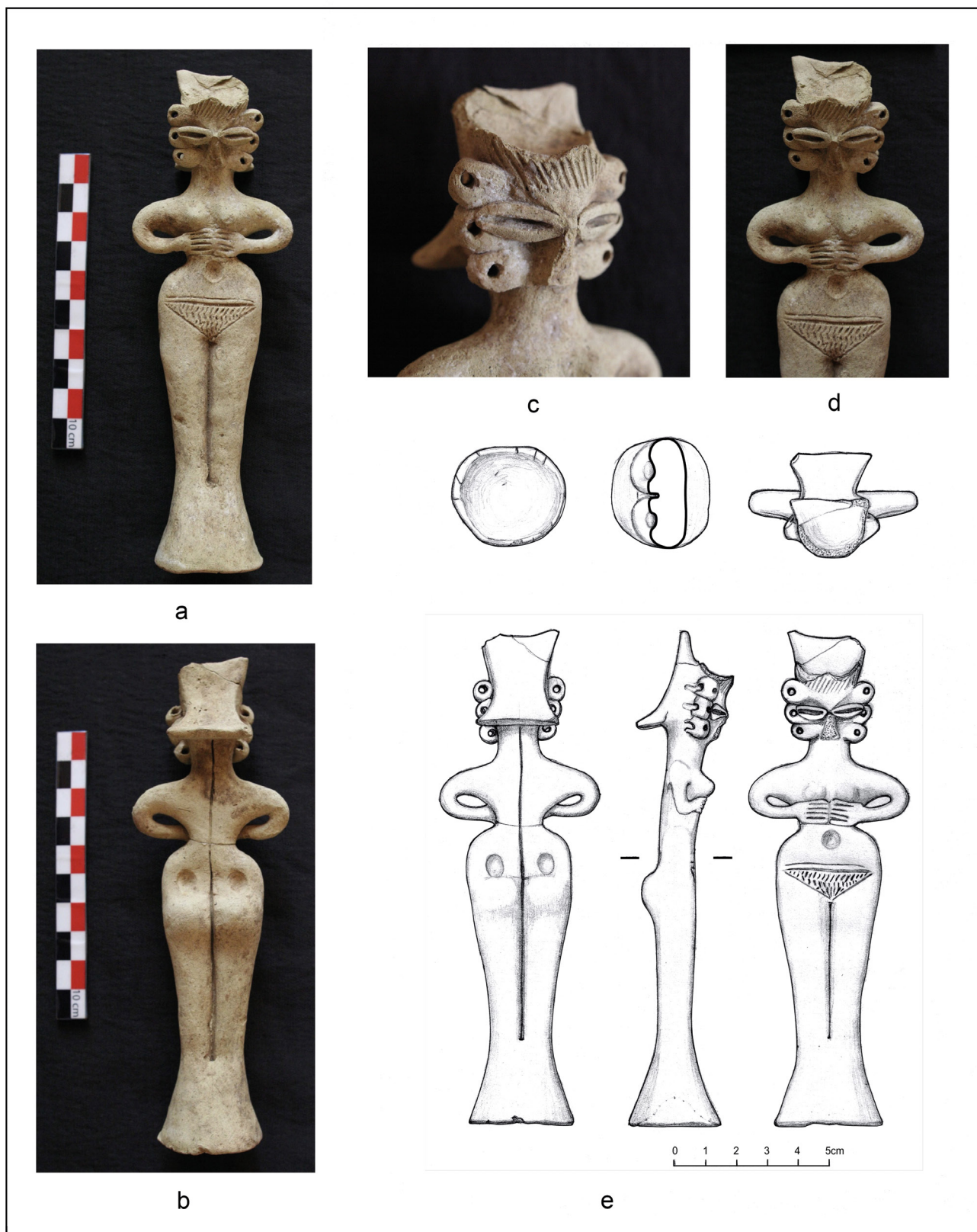
Fig. 1 : Figurine nue modelée Mari TH06.43, photos face (a), dos (b), détail tête (c) ; torse (d), I. Weygand. Dessins (e) Françoise Laroche-Traunecker, © Mission Archéologique de Mari échelle 1/2, face, dos, profil, détails base, tête et coupe.