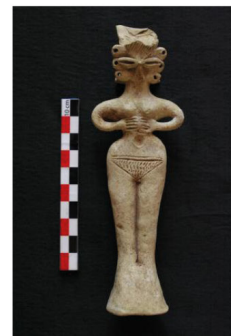
Une des deux statuettes en cours de reproduction.